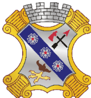
Abb. 4: Abzeichen des „8th Infantry Regiment“