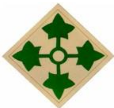
Abb. 3: Abzeichen der „4th Infantry Division“

Das "8 th Infantry Regiment" mit seinen Bataillonen war während des Einsatzes in Vietnam der "4 th Infantry Division („IVY")" unterstellt.