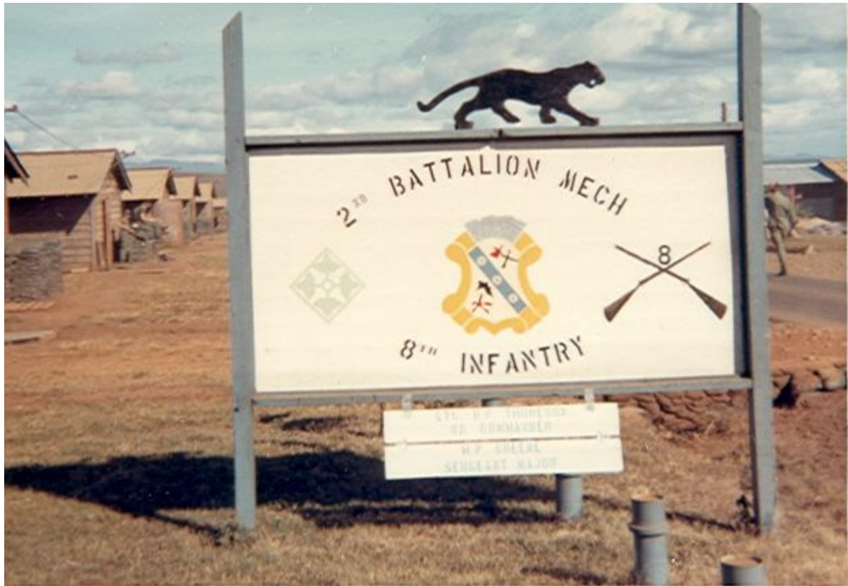
Abb. 10: Schild des „2d Bn Mech/ 8th Inf“ in Vietnam

Es ist aber sehr froh, dass er durch das Auffinden des Zippo wieder Kontakt zu seinen alten Kameraden hergestellt werden konnte. Sie werden sich am 4. Juni 2004 in Las Vegas treffen.