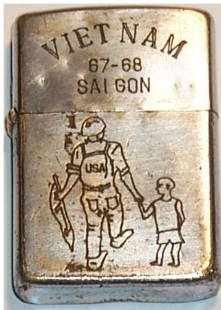
Abb. 2: Klassische Darstellung des Soldaten und des Knaben

Die Zippos stammten entweder aus der Heimat oder konnten in den PX (Post Exchange) bzw. BX (Base Exchange) für $ 1.75 erworben werden. Da aber die Nachfrage bei weitem nicht befriedigt werden konnte, waren die Zippos ein rarer und ebenso wertvoller Artikel. Nicht selten wurden auch Dienstleistungen oder Gegenstände damit „erkauft“.