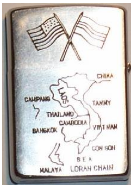
Abb. 3: Zippo Bien Hoa 1969 – 1970 (Vorder- und Rückseite)

Viele Zippos könnten eine interessante Geschichte erzählen, welche heute leider nur noch erahnt werden kann. Das erlittene Leid und die Entbehrungen widerspiegeln