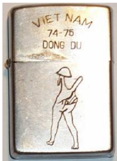
Abb. 6: Vietnam Zippo Fälschung Dong Du 1974 – 1975 (hergestellt 1979 !!)

Fälschungen lassen sich recht gut anhand der folgenden Kriterien identifizieren: