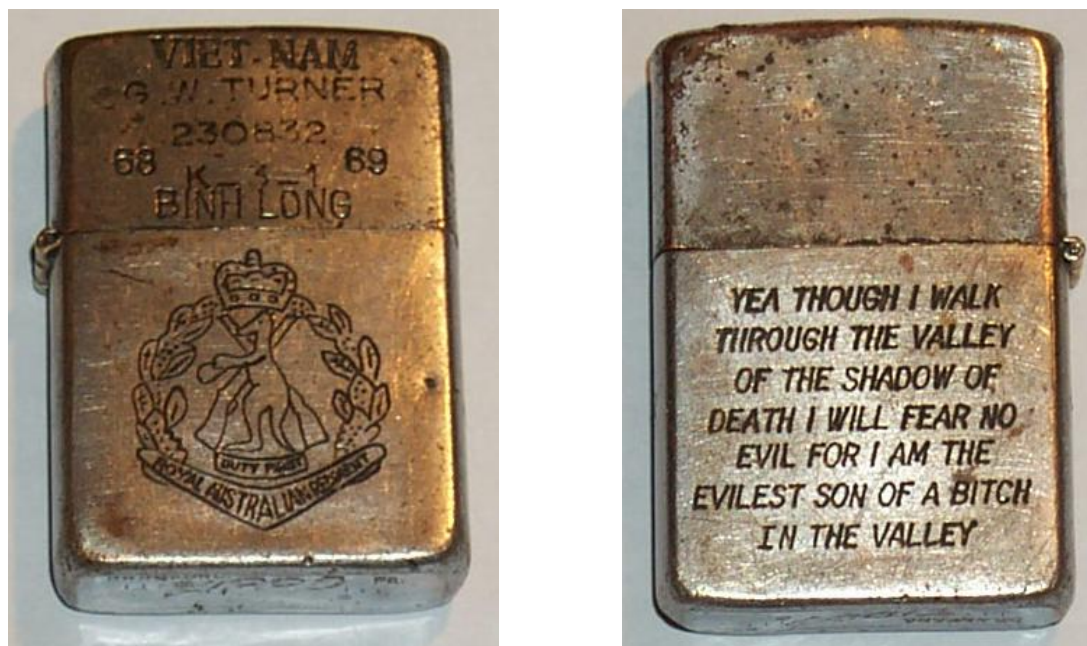
Abb. 4: Vorder- und Rückseite des Zippos mit abgewandeltem Psalm 23

Auf der Rückseite befindet sich eine „populäre“ Version des Psalm 23, welche im übrigen recht verbreitet war.