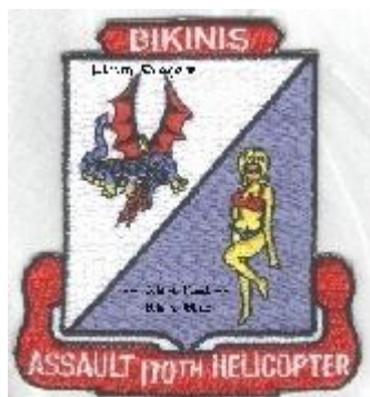
Abb. 3: Abzeichen der „BIKINIS“