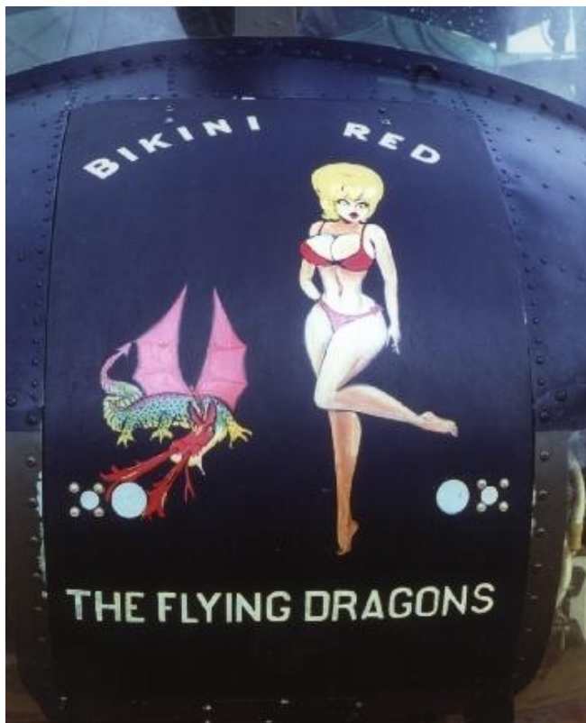
Abb. 6: Logo der „170 th AHC BIKINI RED“ („2 nd platoon“)