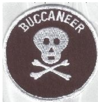
Abb. 4: Abzeichen der „BUCCANEER“

Im Buch von Shelby L. Stanton sind die „Callsigns“ der „170 th AHC“ ebenfalls dokumentiert: