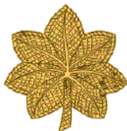
Abb. 9: Gradabzeichen „Major“