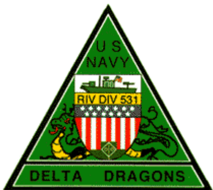
Abb. 2: Abzeichen der „River Division 531“