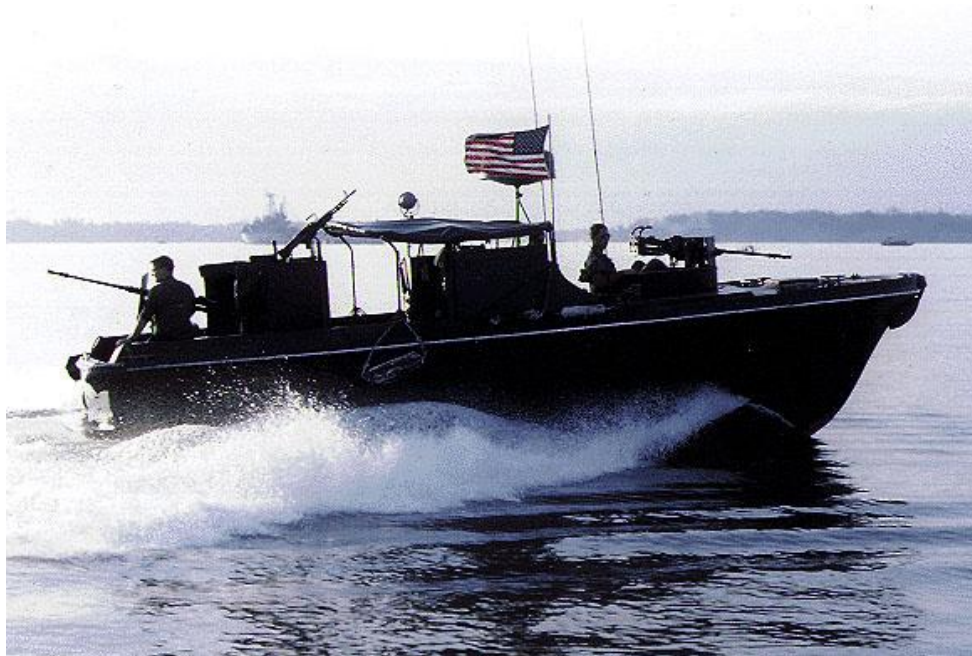
Abb. 5: Patrouillenboot PBR 110