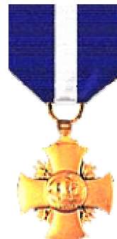
Abb. 7: „Navy Cross“

Unter folgendem Link konnte die Verbindung zwischen James W. Beard und der „River Division 531“ hergestellt werden: http://www.eiis.net/cmart/rivsecdiv531.html .