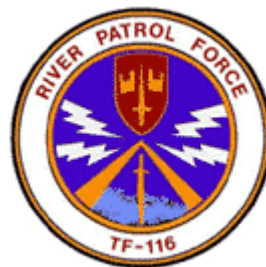
Abb. 3: Abzeichen der „River Patrol Force TF-116“

Der Bodenstempel des Zippos besagt, dass es im Jahre 1969 in Bradford, PA. hergestellt wurde: