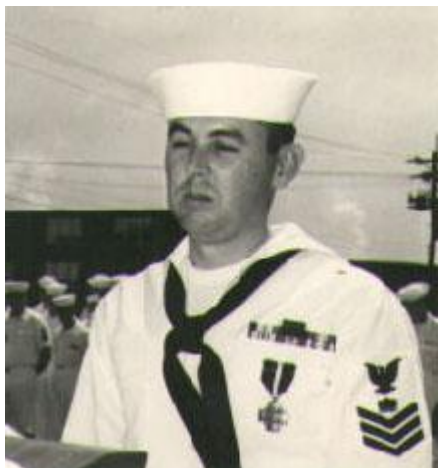
Abb. 6: MN1 Cecil H. Martin mit verliehenem „Navy Cross“

Er leistete als Bootsschütze u.a. Dienst auf dem ehemaligen Boot von Cecil H. Martin, dem PBR 110 (siehe Abb. 5). Cecil H. Martin wurde für seine Verdienste in Vietnam mit dem „Navy Cross“ ausgezeichnet.