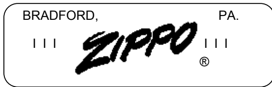
Abb. 2: Schematische Darstellung des Bodens (Herstellung 1968)

Der Bodenstempel des Zippo besagt, dass es im Jahre 1968 in Bradford, PA. hergestellt wurde: