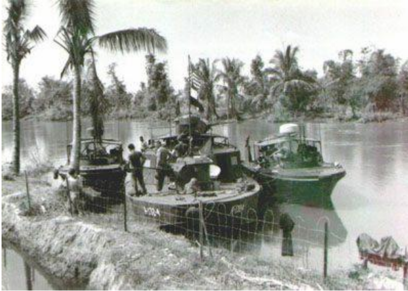
Abb. 5: Patrouillenboot in Vietnam

Die Schlussfolgerung, dass er lange in der U.S. Navy diente, lässt sich aufgrund einzelner Informationen aus dem Internet ableiten. So diente er u.a. auf der U.S.S. Harry F. Bauer (DM-26, 1956 ausser Dienst gestellt), als auch auf der U.S.S. Seawolf (SSN-575, 1967 – 1968).