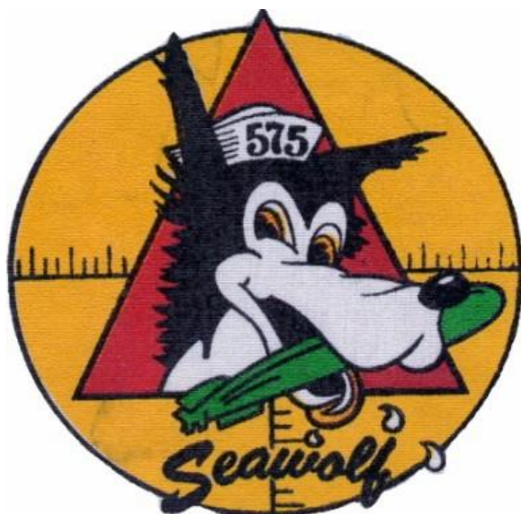
Abb. 8: Altes Abzeichen der U.S.S. Seawolf (SSN-575)