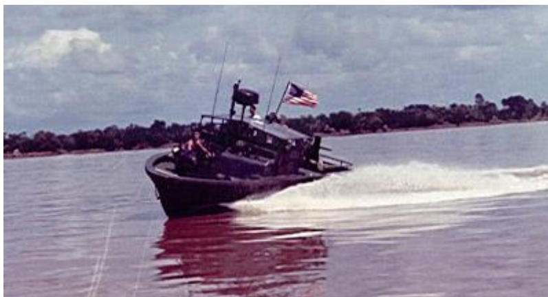
Abb. 4: Patrouillenboot in Vietnam