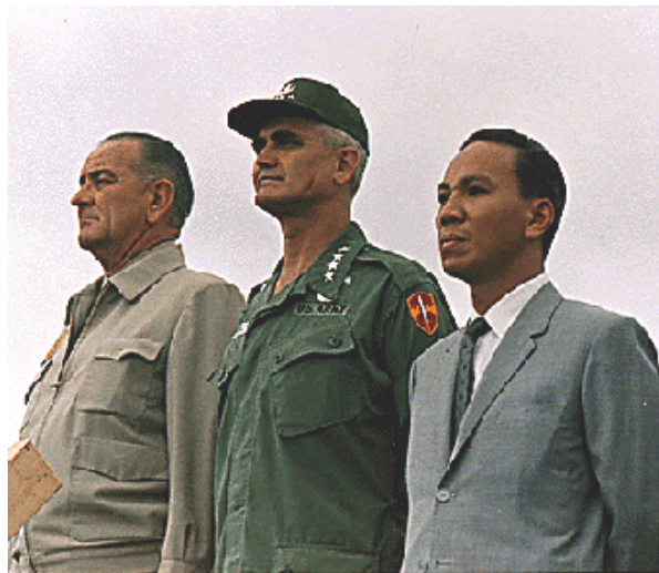
Abb. 5: General William Westmoreland

Weitere Details liessen sich leider bisher nicht in Erfahrung bringen. Dies ist eigentlich auch nicht weiter erstaunlich, da Informationen über Nachrichtendienste für die Öffentlichkeit in der Regel nicht zugänglich sind.