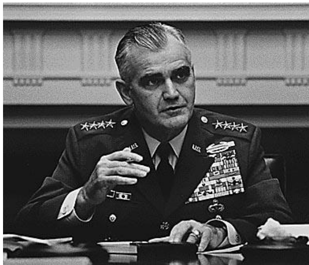
Abb. 4: General William Westmoreland