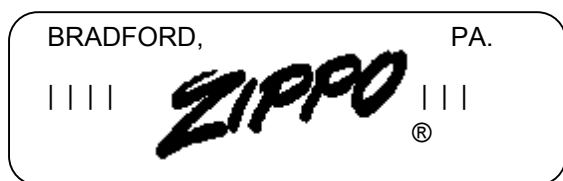
Abb. 2: Schematische Darstellung des Bodens (Herstellung 1967)

Der Bodenstempel des Zippos besagt, dass es im Jahre 1967 in Bradford, PA. hergestellt wurde: