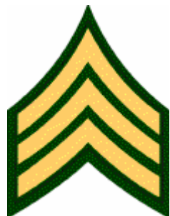
Abb. 5: Gradabzeichen „Sergeant“ (E-5)