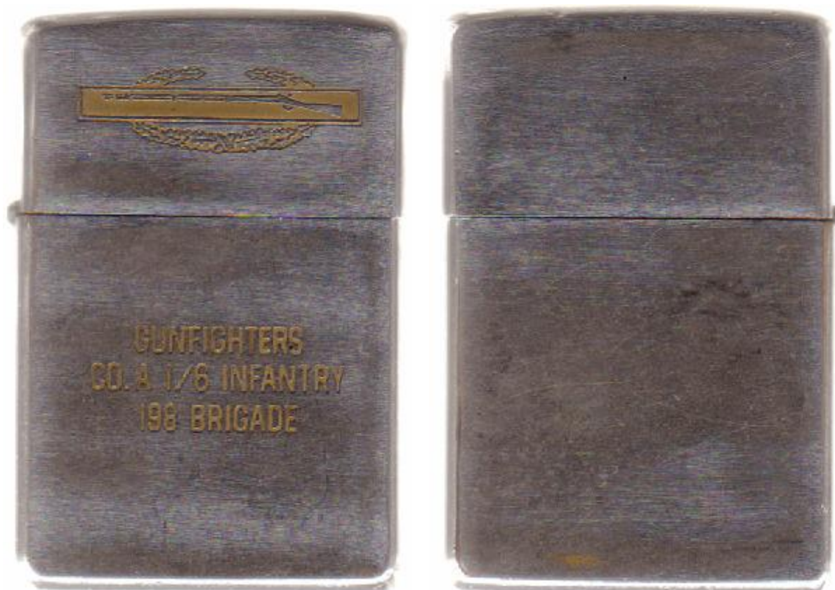
Abb. 1: Zippo „RICK THORPE“ (Vorder- und Rückseite)

Auf der Vorderseite wurden das Abzeichen sowie die Inschriften industriell durch eine Säurebad hergestellt und mit Farben versehen. Von den Farben ist allerdings nichts mehr vorhanden. Neben dem „Combat Infantryman Badge 1st Award“ sind die Inschriften „GUNFIGHTERS“, „CO.A 1/6 INFANTRY“ und „198 BRIGADE“ vorhanden.