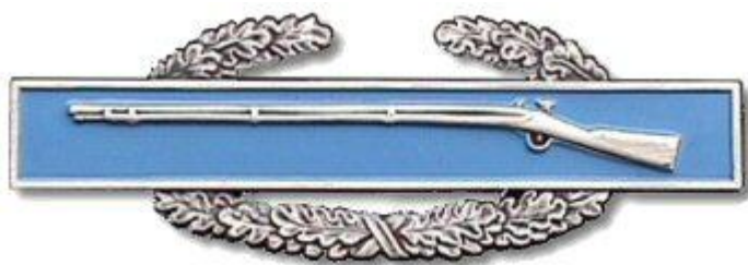
Abb. 2: Abzeichen "Combat Infantryman Badge 1st Award"

Bei der Einheit handelt es sich um die A Kompanie des 1. Infanterie Bataillons des 6. Infanterie Regimentes. „GUNFIGHTER 6“ war ursprünglich der Rufname des Kompaniekommandanten der A Kompanie. Obwohl die Rufnamen der Funknetze änderten, blieb der Spitzname der A Kompanie „ GUNFIGHTERS “. Dieses Bataillon war zu Beginn des Konfliktes unter dem Kommando der „198 th Light Infantry Brigade“ („198 th LIB“), später zusätzlich der „23 d Infantry Division (Americal Division)“.