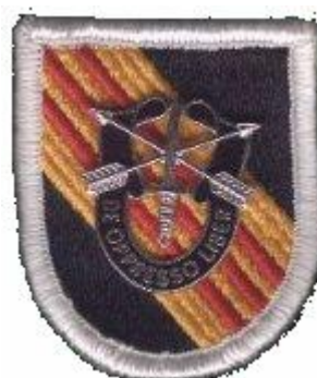
Abb. 9: Abzeichen der „5 th Special Forces Group“ (Beret)

Im allgemeinen findet man über die Special Forces nur relativ wenige, aussagekräftige Detailinformationen. Aber wiederum im Internet fand sich eine Übersicht über die einzelnen Detachements der „5 th Special Forces Group“ in Vietnam. Basierend auf diesen Informationen wurde durch das Detachment B-34 im Mai 1965 ein Camp in Song Be, Provinz Phuoc Long, eröffnet.