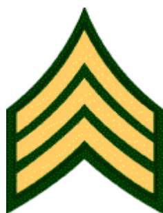
Abb. 8: Gradabzeichen „Sergeant (SGT)“

Aufgrund seiner Funktion „03Z5S“ als Sergeant bei den „Special Services“ kann die Verbindung zu den „Special Forces“ hergestellt werden.