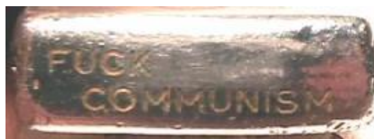
Abb. 4: Seitenansicht Zippo „SONG BE“

Die Inschrift auf der Seite des Feuerzeuges (siehe Abb. 4) lässt keinen Zweifel an der politischen Überzeugung des ehemaligen Besitzers.