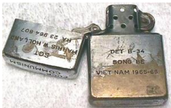
Abb. 3: Zippo „SONG BE“ in geöffnetem Zustand