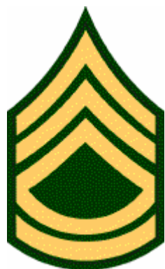
Abb. 10: Gradabzeichen „Sergeant First Class (SFC)“

Im allgemeinen findet man über die Special Forces nur relativ wenige, aussagekräftige Detailinformationen. Aber wiederum im Internet fand sich eine Übersicht über die einzelnen Detachements der „5 th Special Forces Group“ in Vietnam. Basierend auf diesen Informationen wurde durch das Detachment B-34 im Mai 1965 ein Camp in Song Be, Provinz Phuoc Long, eröffnet.