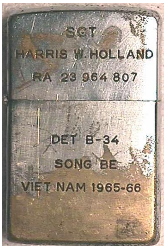
Abb. 1: Vorderseite Zippo „SONG BE“

Sergeant Holland war ursprünglich in der Nationalgarde des Staates Pennsylvania, was sich aus seiner „Service number“ (ähnlich der Matrikelnummer) RA 23 964 807 schliessen lässt. Er leistete seinen Dienst in Vietnam im Detachement B-34 in Song Be während der Jahre 1965 – 1966. Die Nummer des Detachementes (B-34) deutet auf die „Special Forces“ der U.S. Army hin.