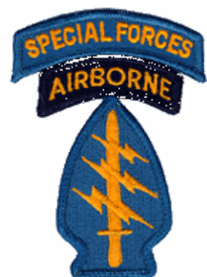
Abb. 11: Abzeichen der „Special Forces“ Class (SFC)“