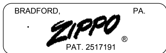
Abb. 5: Schematische Darstellung des Bodens (Herstellung 1965)

Der Bodenstempel des Zippos besagt, dass es im Jahre 1965 in Bradford, PA. hergestellt wurde: