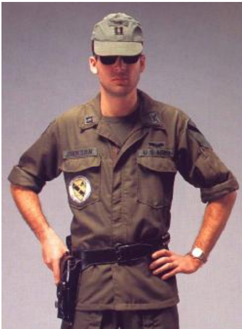
Abb. 5: Helikopterpilot, Captain

Eine ähnliche Jacke ist im Buch „ VIETNAM: US UNIFORMS IN COLOUR PHOTOGRAPHS “ von Kevin Lyles auf der Seite 83 zu sehen: