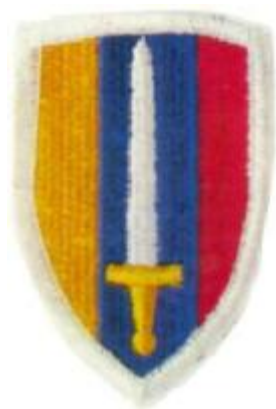
Abb. 3: Abzeichen „U.S. Army Vietnam“

Auf der rechten Schulter ist das Abzeichen der „U.S. Army Vietnam“ in getarnter Ausführung aufgenäht: