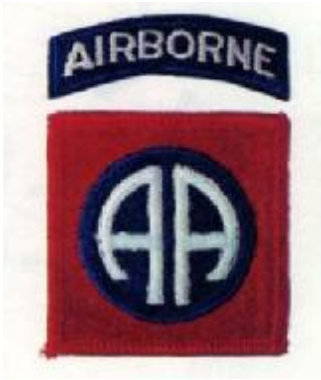
Abb. 4: Abzeichen der „82 nd Airborne Division“