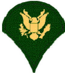
Abb. 2: Gradabzeichen „Specialist 4“

Üblicherweise waren dies Mannschaften mit den Graden „Specialist 4“ oder „Specialist 5“.